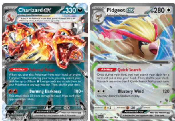
Esta imagen le pertenece a Creatures Inc.